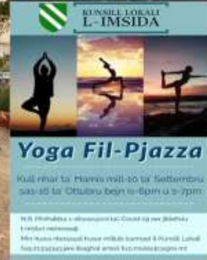
Sport u inizjattivi oħra