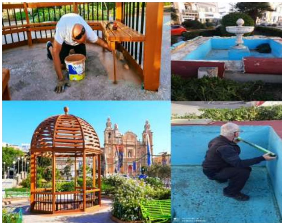
Xogħol f'Misraħ 5 ta'Ottubru u fil-funtana ta'Rue D'Argen