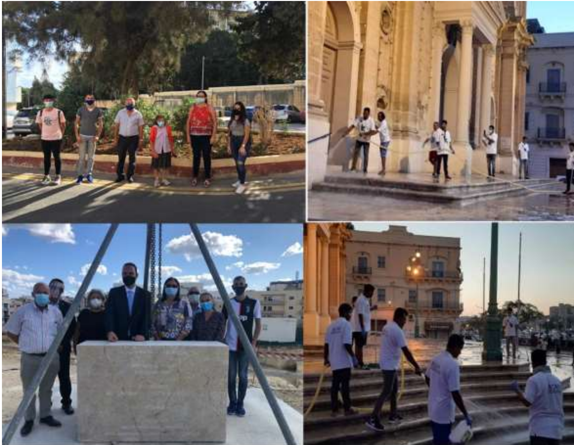
Kollaborazzjoni FI-interess tal-lokalita