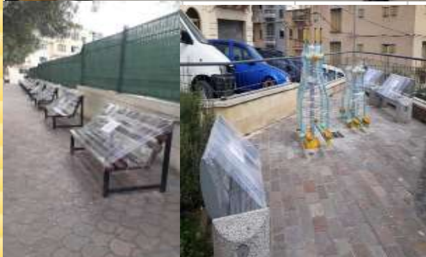
You Safe / Covid 19