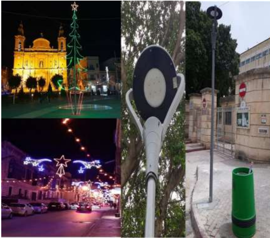
Tizjin għall Milied u Dawl ġdid hdejn il-Junior College