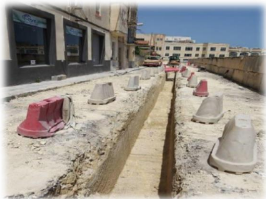
Triq Giorgio Mitrovich