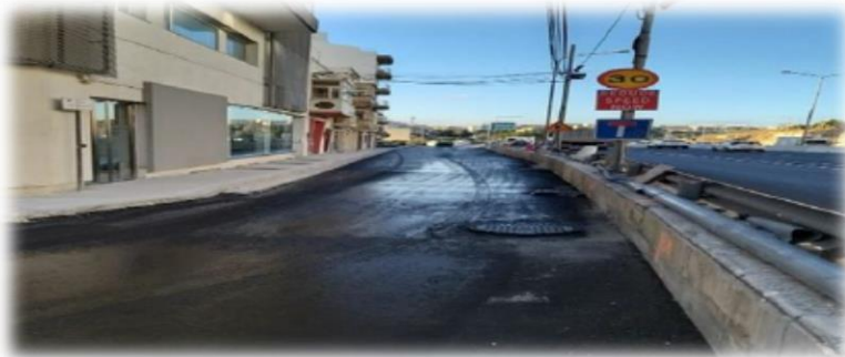
Trejqa ta' Box Box

Matul is-sena 2019 beda u tlesta l-ewwel nofs tax-xogħol fuq il-pont tal-Wied ta' l-Imsida. Dan wasal biex kien hemm titjeb fis-sistema tat- traffiku filwaqt li parti mit-triq inbidlet f'masġar żgħir .