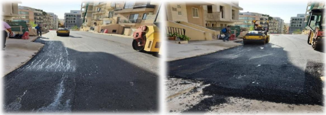
Triq it-Torri n-naħa tas-Swatar (l-Imsida)