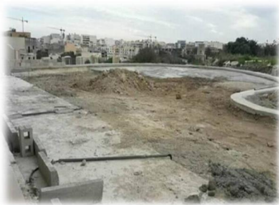
Triq Mons Innoċenz Zammit